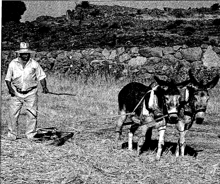
Traditionelle Landwirtschaft in Spanien begünstigt das Vorkommen vieler Vogelarten der Steppe.