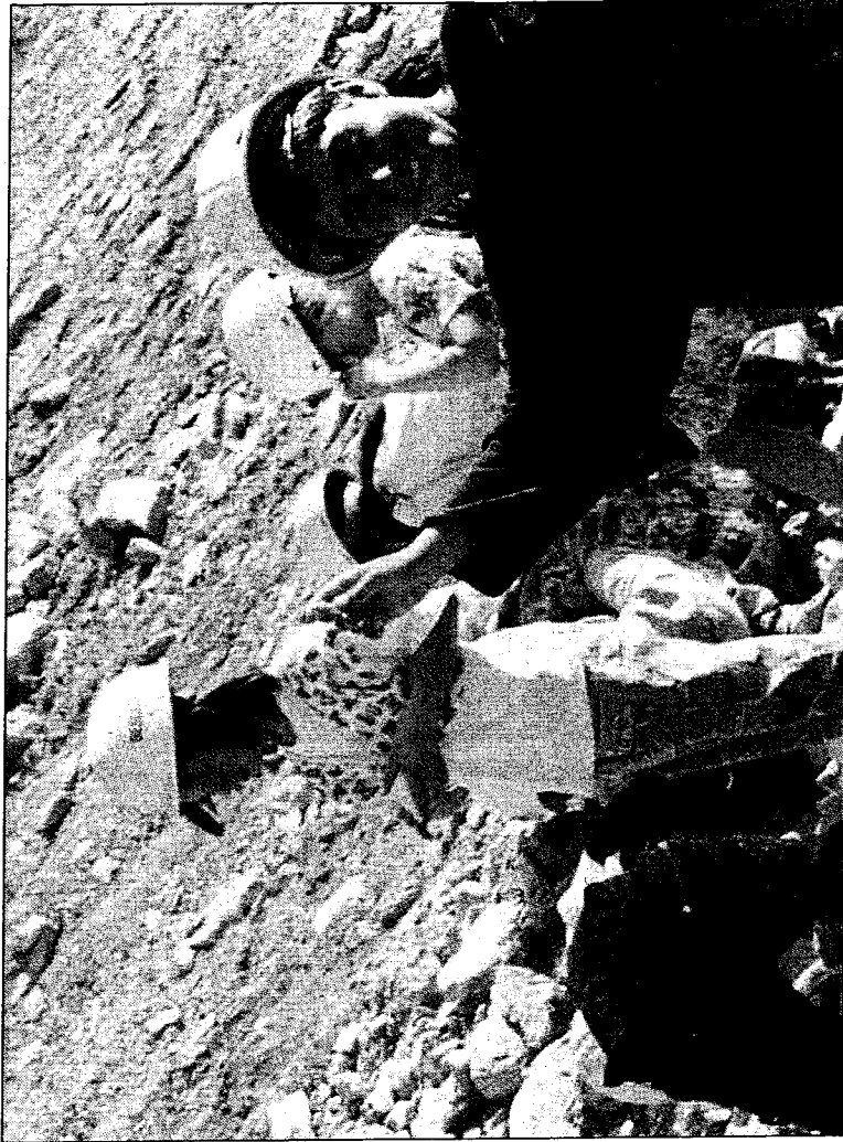
Fossilien sammeln dürfen nach 95 Millionen Jahre alten Versteinerungen suchen.

Zur Zeit stehen Orchideen, Akelien, Margeriten und viele andere Wiesensblumen in voller Blüte. Gartenfreunde brauchen aber keinen Spaten mitzubringen. Die Landschaftsgärtnerei aus Bad Iburg, die zurzeit mit der Bepflanzung rund